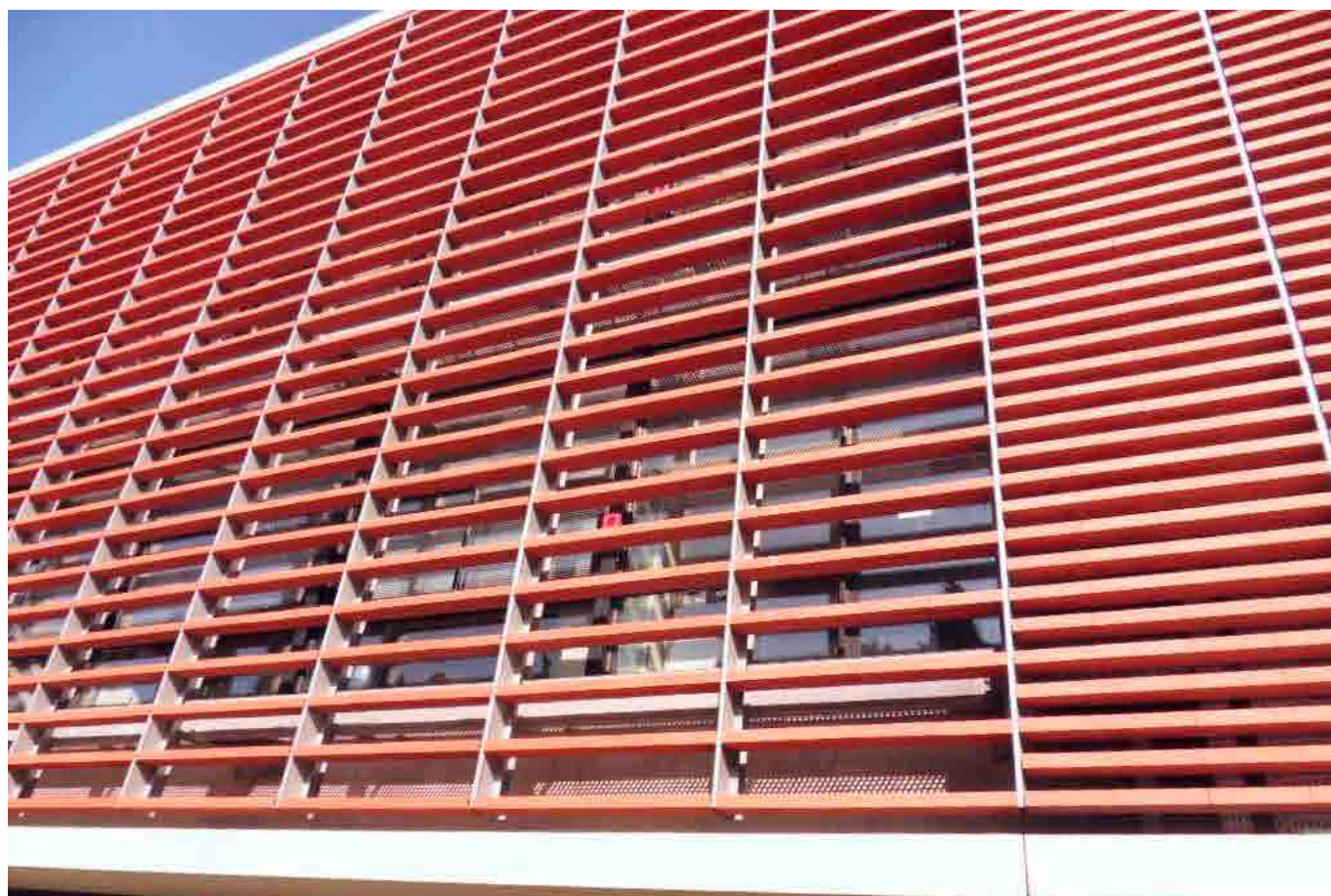
Immeuble de bureaux – Zac Agroparc – Avignon (84)

Les investisseurs « long terme » recherchent tous le même type d'actifs et concentrent leur attention sur des immeubles « prime » et sécurisés par des baux de longue durée avec des locataires de qualité. La contrepartie de cet engouement est la compression des taux de rendement qui demeurent orientés à la baisse et qui ont atteint le seuil de 4% pour des actifs situés dans le quartier central des affaires à Paris.