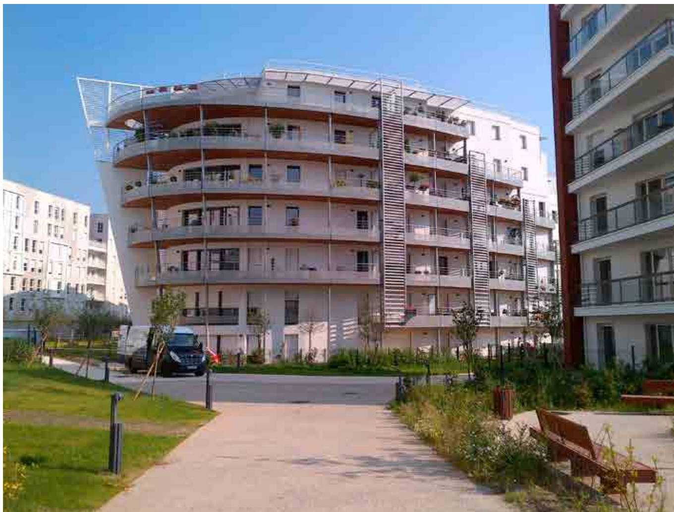
Immeuble à Issy-Les-Moulineaux

Les ventes à investisseurs ne représentent plus que 37% des ventes du trimestre là où elles culminaient autour de 75 % dans les meilleures années du dispositif Scellier.